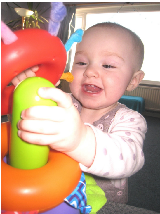
Un enfant en train de jouer